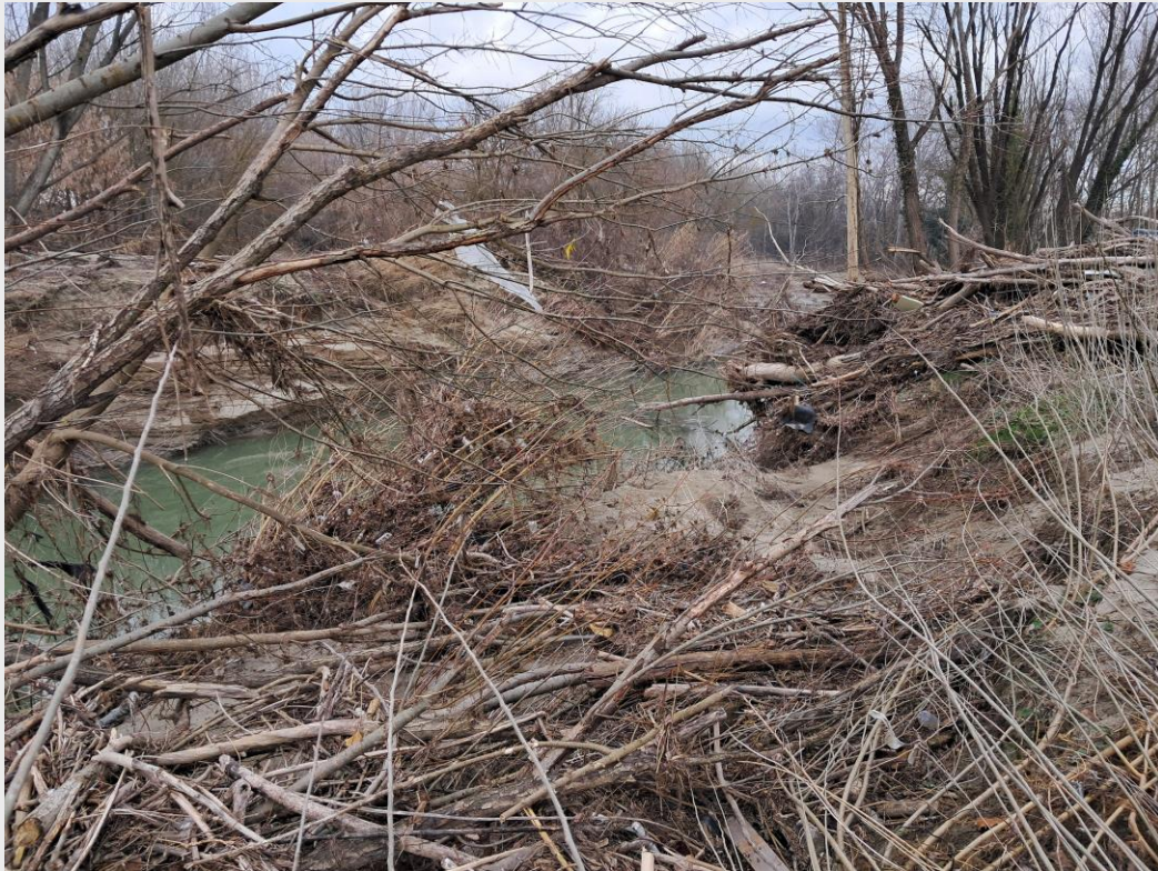
IDICE CASTENASO PRE INTERVENTO