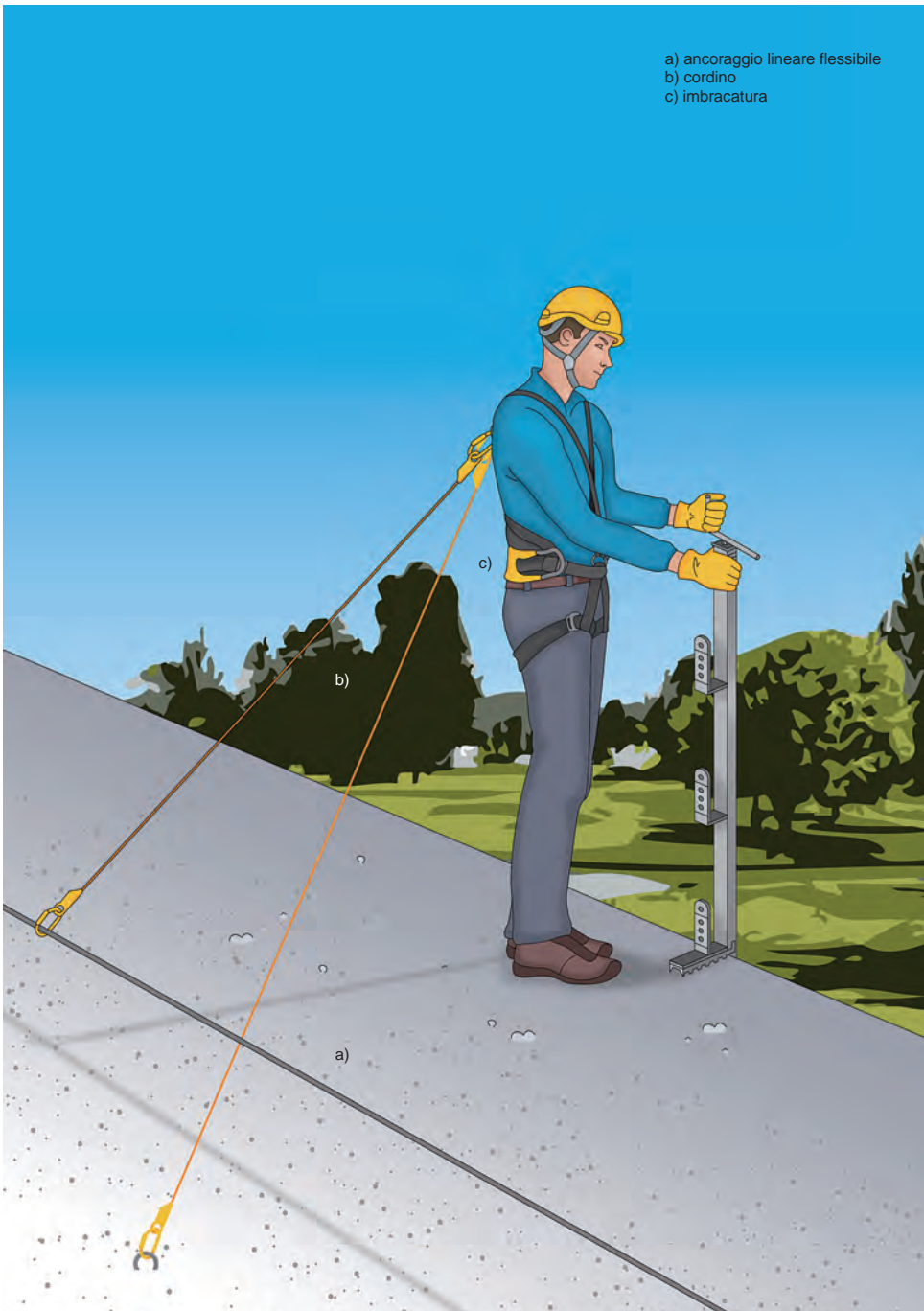
Figura 1 - Esempio di un sistema di trattenuta