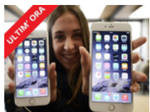
Come questa ragazza riesce ad avere un iPhone ogni mese quasi GRATIS ( bidoo.com )