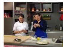
La scuola di cucina Artusi protagonista nella TV svizzera