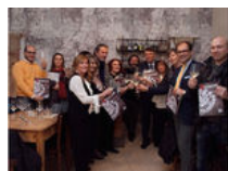
ACesena Winter 2015, presentato un nuovo numero del magazine sulla città