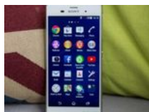
Come ricevere un cellulare Android con 2 euro? ( maxioccasioni.com )