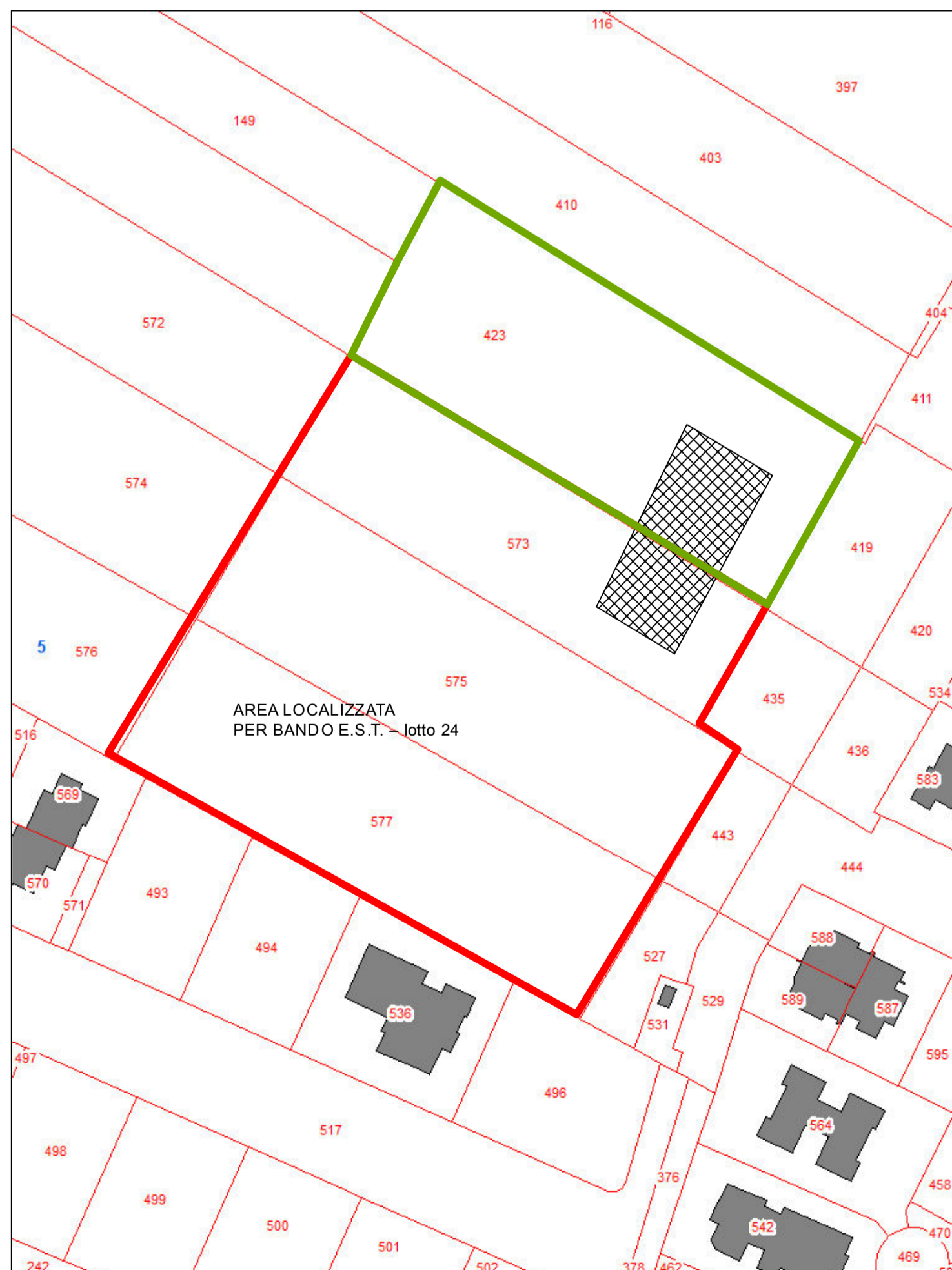
estratto catastale Fg. 5 map.le 423 parte (3.954m 2 ) parte in area già localizzata: vedi Lotto 24 degli EST