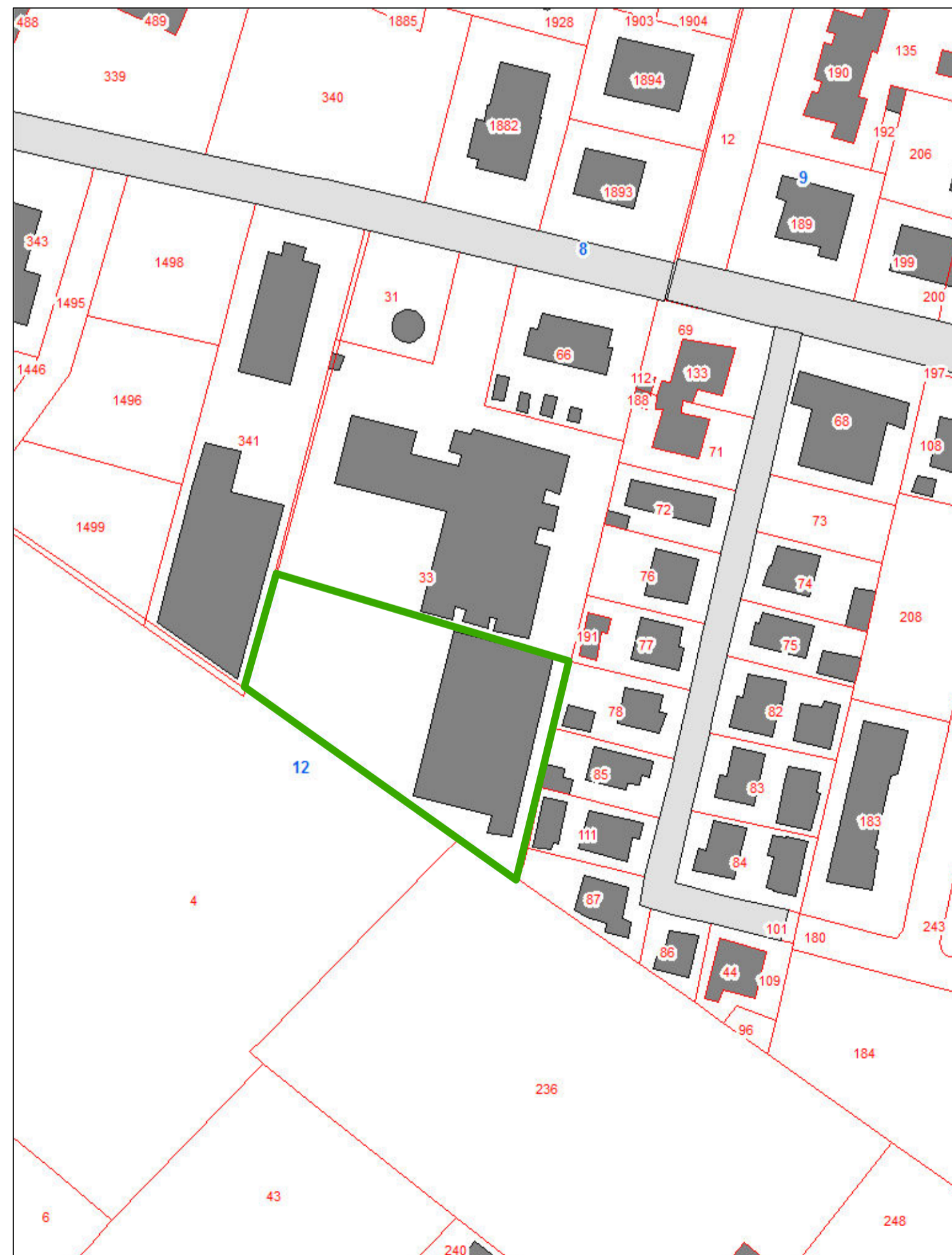
estratto catastrale Fg 12 map.le 33 parte